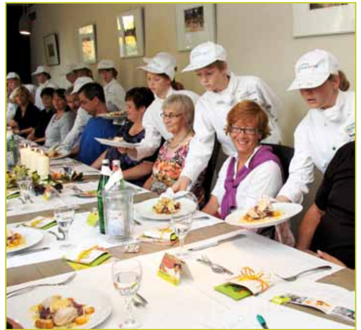
... und die Miniköche in Wesel handeln fair.