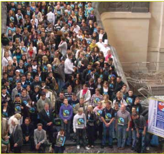
Für Nachwuchs ist gesorgt: Auszubildende in Hannover ...