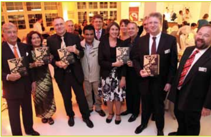
Ausgezeichnet für besonderes Engagement für den Fairen Handel.