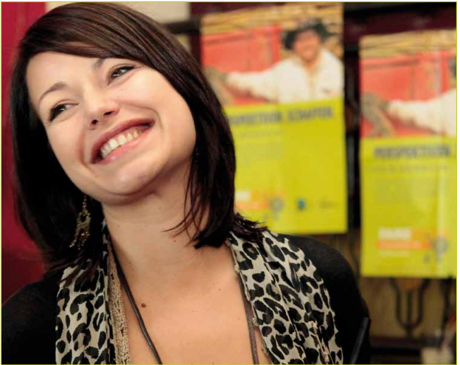
Die Schauspielerin Cosma Shiva Hagen eröffnete die Faire Woche in Hamburg.