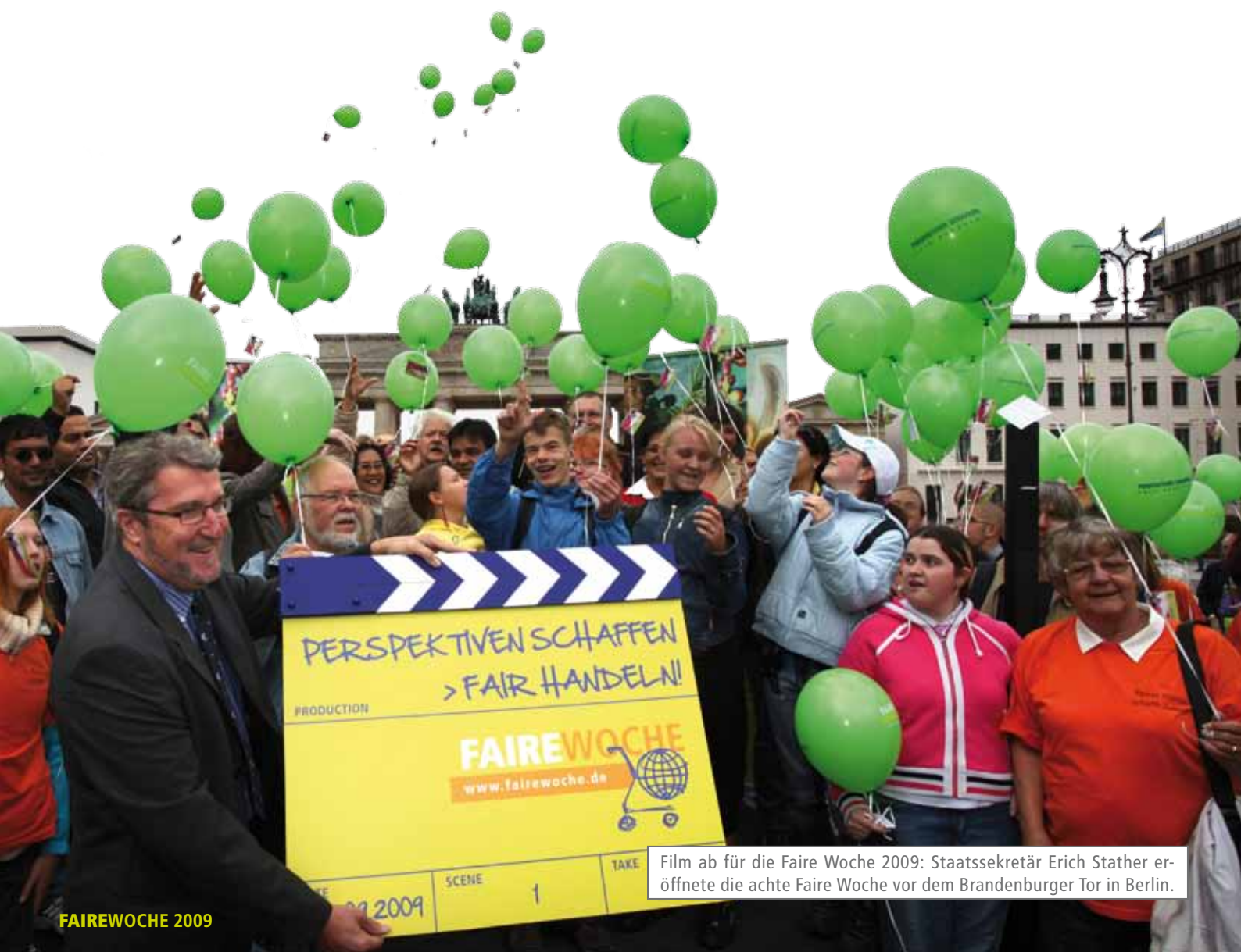
Film ab für die Faire Woche 2009: Staatssekretär Erich Stather eröffnete die achte Faire Woche vor dem Brandenburger Tor in Berlin.