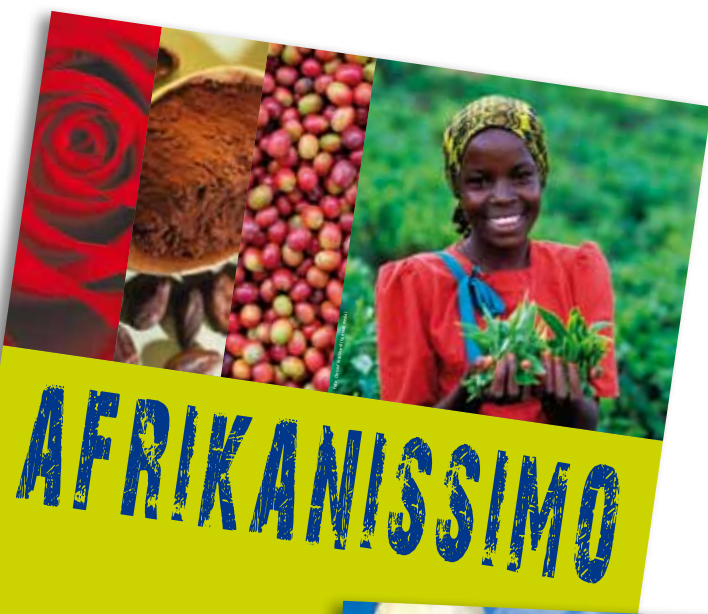
Die Plakate der letzten Fairen Wochen 2007 - 2009.

Insgesamt lässt sich feststellen, dass sowohl die Bekanntheit des Fairen Handels als auch die Umsätze mit fair gehandelten Produkten steigen. Wir freuen uns sehr darüber und hoffen auf eine Fortsetzung dieser Entwicklung in den kommenden Jahren. Das Forum Fairer Handel als Veranstalter der Fairen Woche bedankt sich an dieser Stelle sehr herzlich für die Förderung in den vergangenen Jahren durch das Bundesministerium für wirtschaftliche Zusammenarbeit und Entwicklung, Brot für die Welt, den Evangelischen Entwicklungsdienst sowie MISEREOR.