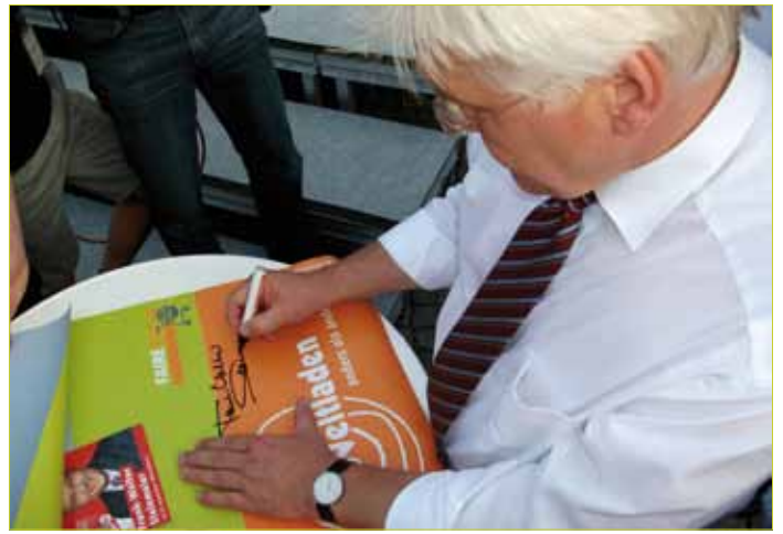
Kanzlerkandidat Frank Walter Steinmeier signierte das Weltladenplakat.