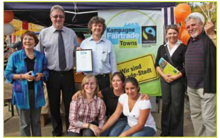
Freude über die Doppelauszeichnung in Marburg.