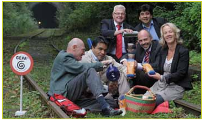
Bahn frei für den neuen Trassenkaffee der GEPA.