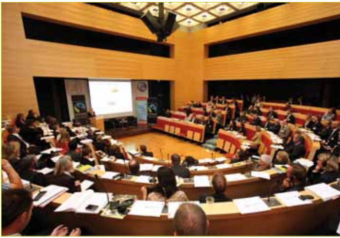
Die internationale Fairtrade Konferenz fand zum zweiten Mal statt.