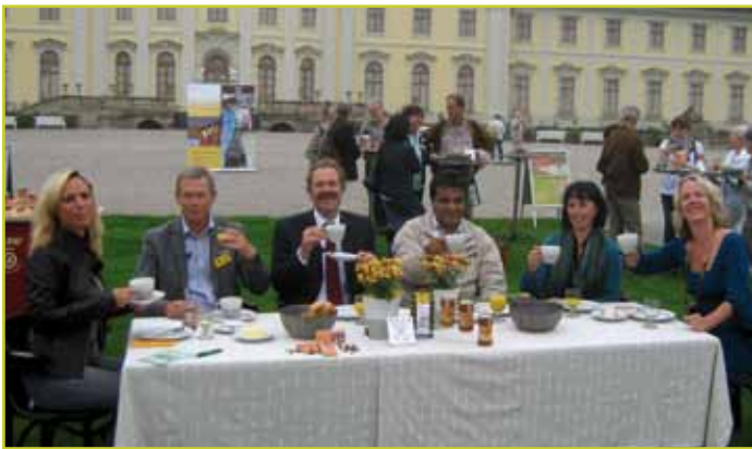
Eine faire Kaffeetafel vor dem Ludwigsburger Barockschloss.