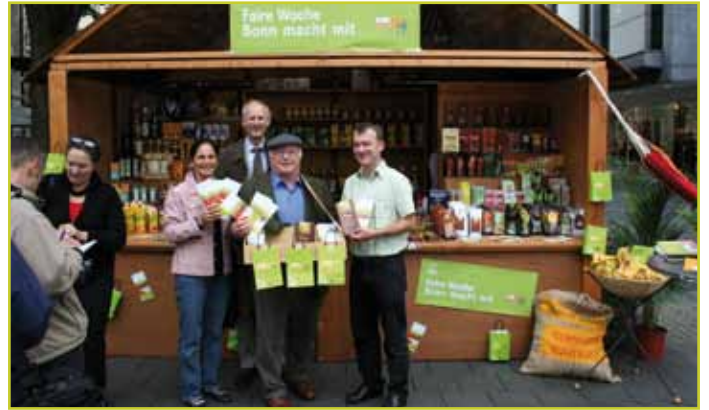
Norbert Blüm unterstützte die Akteure in Bonn.